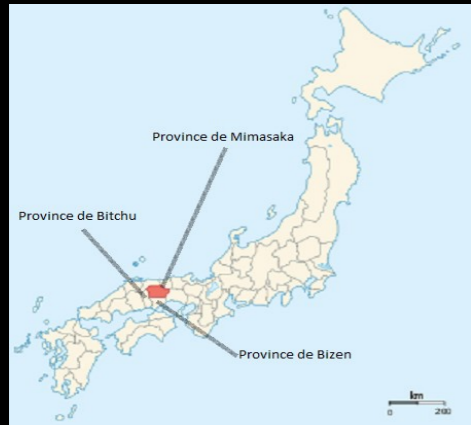
Carte des anciennes provinces

A l'époque féodale, cette province avait pour capitale la ville de TSUYAMA.